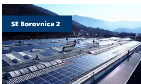
SE Borovnica 2