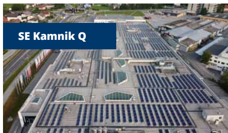
SE Kamnik Q